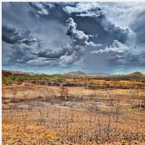
NORTH 1 2015 © Les Walkling