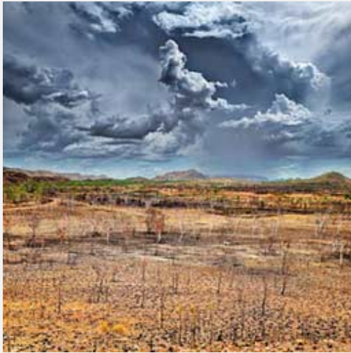
NORTH 1 2015